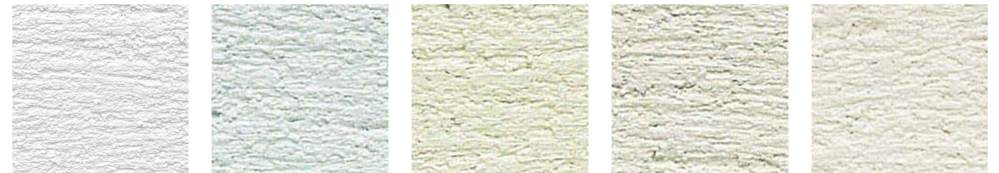
T-01 T-02 T-03 T-04 T-05